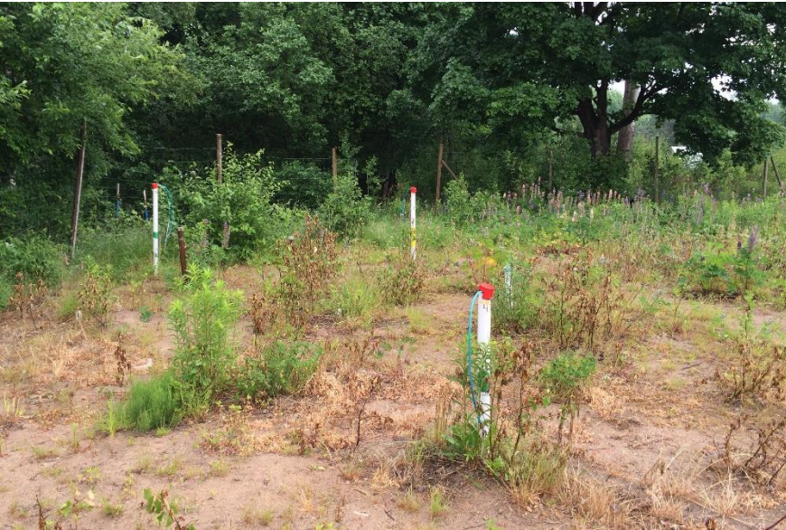
F.d. kemtvätt i Värnamo. Reduktiv deklorering